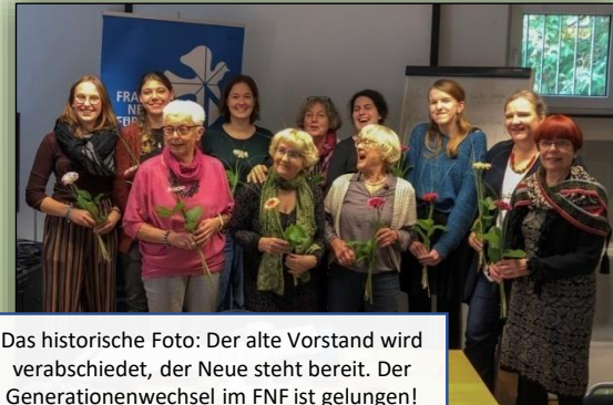
MV am 9. November

Das historische Foto: Der alte Vorstand wird verabschiedet, der Neue steht bereit. Der Generationenwechsel im FNF ist gelungen! Weiterhin gilt: Gemeinsam sind wir stark!